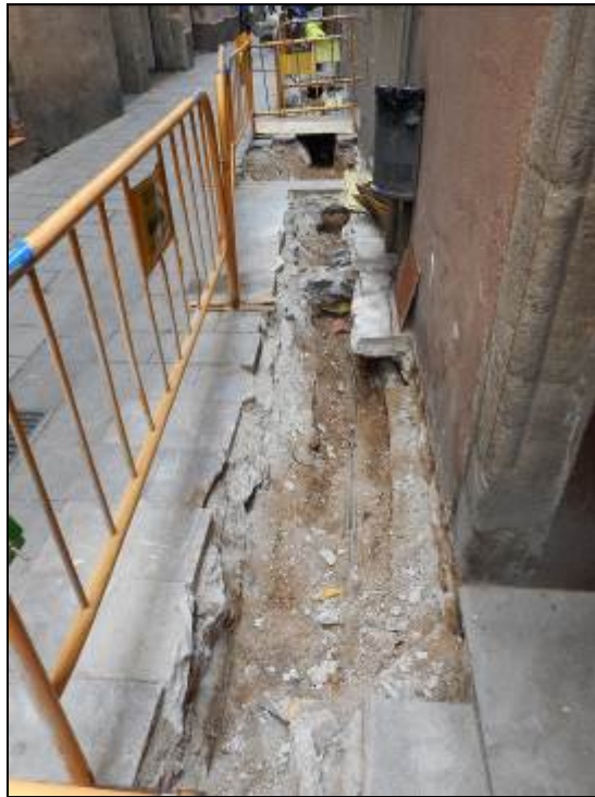
1. Inici dels treballs davant el NÚM.64 del Carrer Sant Pere Mitjà.