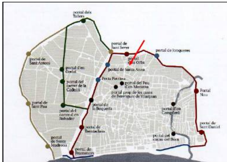
Croquis de la ciutat i situació de les diferents fases de construcció de la muralla medieval. (Planta de A. Cubeles)

Una última fase suposarà el tancament de la muralla de mar, fins aquest moment inexistent, però necessària a partir del s. XVI pel nou perill turc. L'obra de les muralles de mar fou dirigida per Francesc de Borja, lloctinent de Catalunya, que tenia l'encàrrec de l'emperador d'acabar la defensa de la platja de Barcelona.