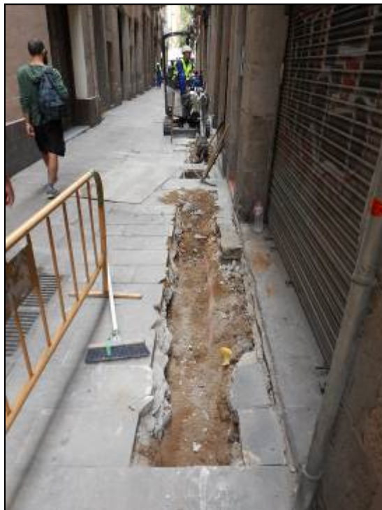
2. Buidat mecànic de la rasa.