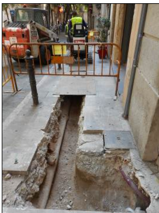
6. Rasa davant el NÚM.14 de la Plaça de Sant Pere.