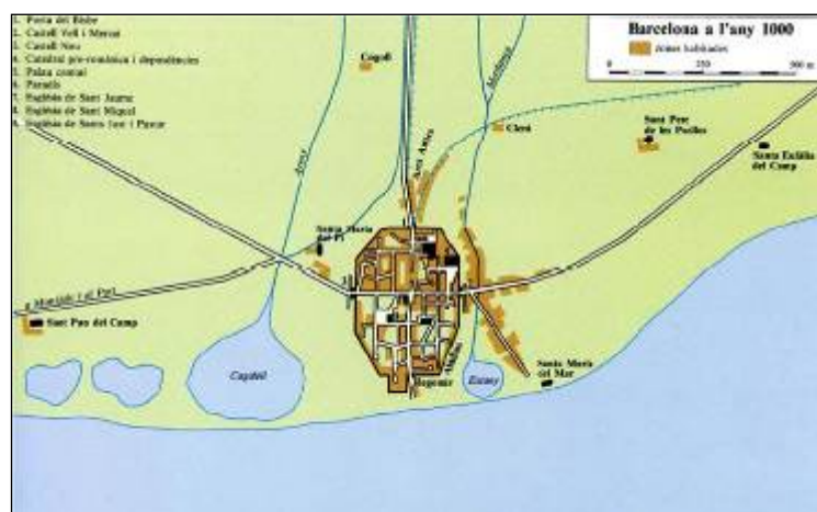
Barcelona a l'any 1000, segons Philip Banks (Catalunya Romànica Vol. XX)

Com a conseqüència de l'augment de població que es produeix ja des de començament del s. IX , s'urbanitzà una part del territori que ocupava fora del recinte de les muralles romanes, i per tal de protegir aquests nous nuclis de població anomenats vilanoves al voltant de centres d'ordre econòmic o religiós.