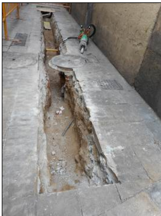
5. Rasa al carrer Sant Pere Mitjà davant el NÚM.93.