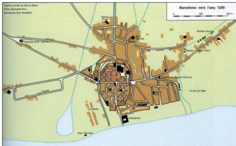
Barcelona a l'any 1200 segons Philip Banks (Catalunya Romànica Vol. XX)

A principis del s. XII la gran expansió demogràfica provocà la creació i creixement d'aquests nuclis poblacionals i de molts obradors al voltant de les muralles, aquest creixement de la ciutat fora de l'antic recinte murari romà serà el responsable de la construcció d'un nou sistema defensiu. Les dades més antigues sobre el començament de les obres d'aquesta nova estructura defensiva fan referència a 1285, però les darreres investigacions i actuacions arqueològiques no han pogut localitzar fins al moment evidències materials ni estructurals per a aquesta cronologia. Cal destacar també la constància des de 1255 de diferents portals al llarg de la ciutat, a més dels que es crearan a partir de 1260, tots ells situats entre l'antic recinte romà i el que es començarà a construir a partir de 1285. Els límits marcats per a la nova muralla quedaran definits pels actuals carrers de La Rambla, Fontanella, Trafalgar, Arc de triomf, Lluís Companys i Passeig Picasso.