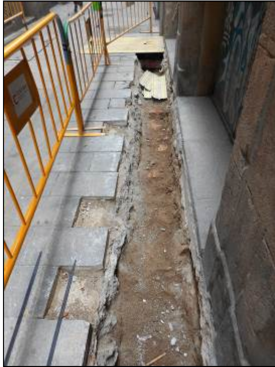
3. Rasa al carrer Sant Pere Mitjà.