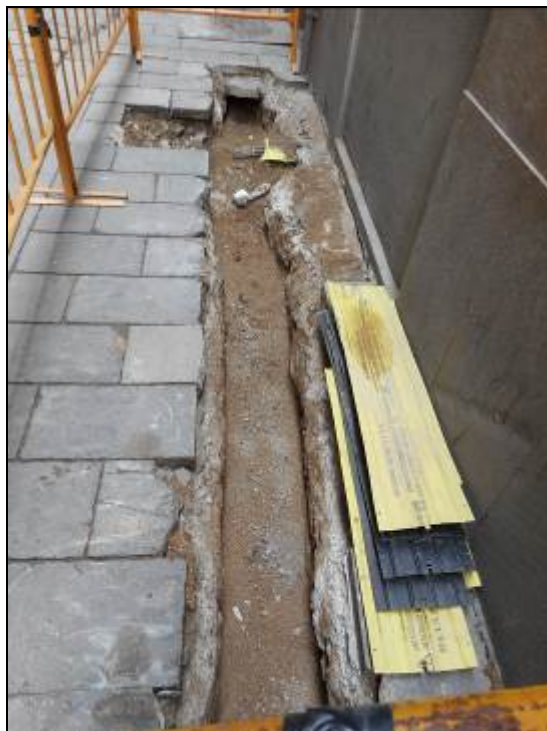
4. Rasa al carrer Sant Pere Mitjà.